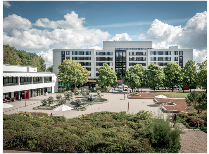
Das Zentralgebäude und der Brunnenplatz heute