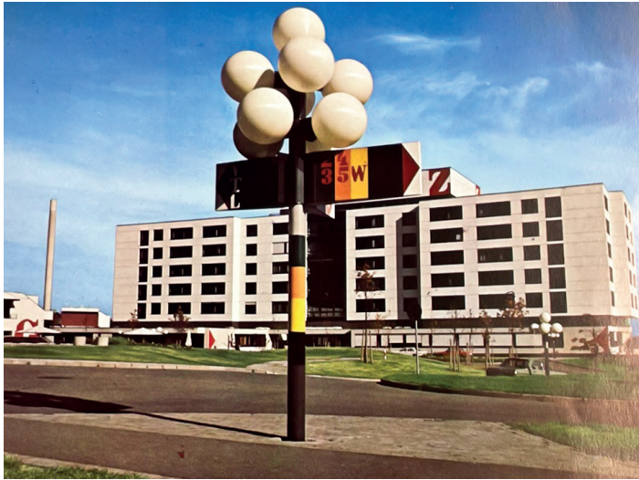
Das Zentralgebäude in seiner Anfangszeit