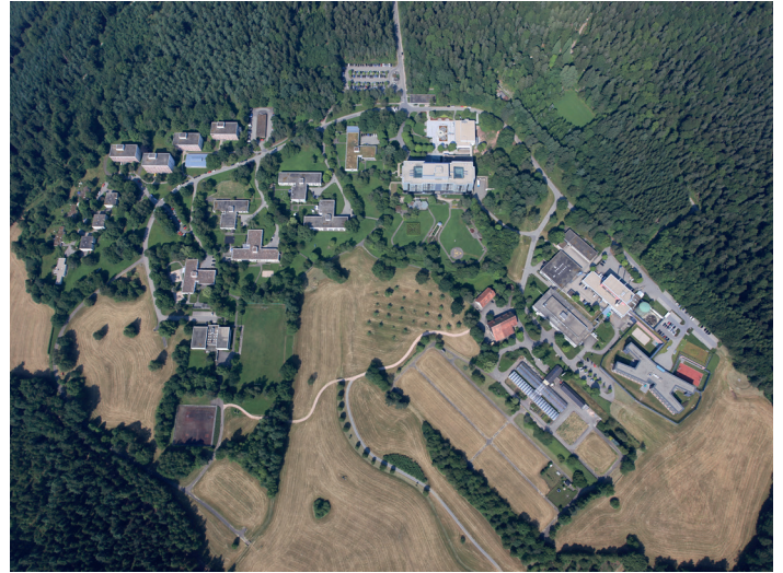
Luftaufnahme des Psychatriegeländes in Calw-Hirsau. 2025 kam ein Erweiterungsbau der Klinik für Forensische Psychiatrie und Psychotherapie hinzu.