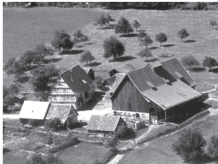
Historische Aufnahme des Lützenhardter Hofes

Die seit 1976 an der Landeslinik Nordschwarzwald bestandene Abteilung Neurologie war zum Jahresanfang 2009 in einem Kooperationsvertrag mit dem Klinikverbund Südwest an das Krankenhaus Calw abgegeben worden, was dort die Gründung einer Stroke Unit zur intensivmedizinischen Behandlung von Schlaganfällen möglich machte.