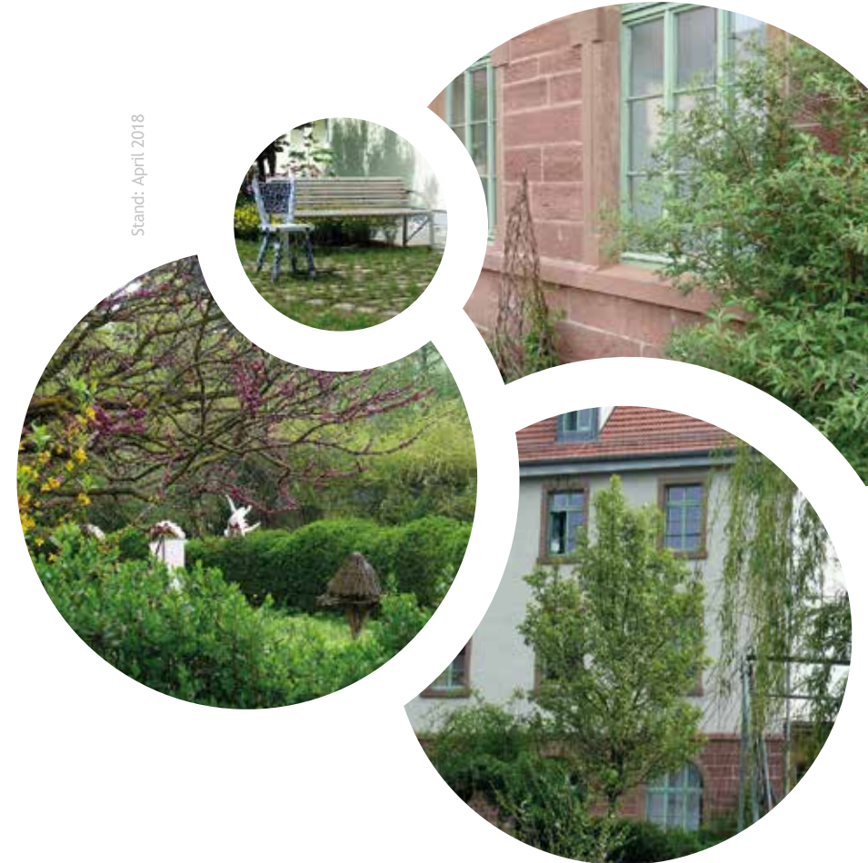
Stand: April 2018

Teilstationäre Behandlungseinrichtung für Menschen mit seelischen Erkrankungen